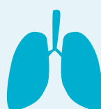
Cancer du poumon