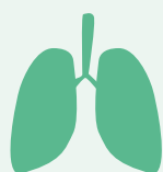
Cancer du poumon