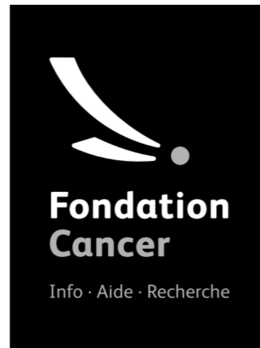
half tone noir / 40% noir tagline: 40% noir