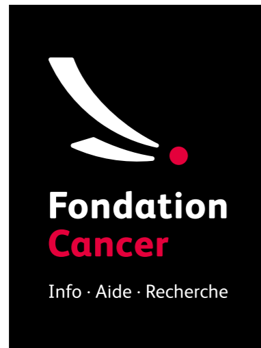
version couleur black / pantone 199 tagline: 40% noir